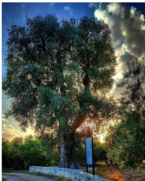
Ulivo di Marescia

In materia di affidamento delle aree verdi comunali (aggiornamento della DCC n.20 del 06/07/2017), diversi spazi urbani sono stati rigenerati grazie alla preziosa collaborazione con realtà del territorio: il Parco di viale Vittorio Veneto , adottato dalla cooperativa San Sebastiano , è stato riaperto con una ricca programmazione di eventi sociali che permettono di vivere l'aggregazione negli spazi verdi. Il Parco Lenoci è tornato fruibile dopo l'affidamento in concessione all'attività